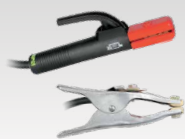
MMA komplet 300 A - 4 m - 35 mm 2 038295