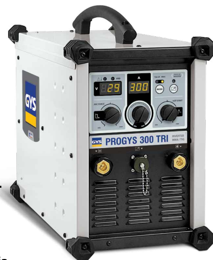
Isporučuje se bez pribora